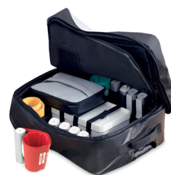
Torba MESI mTABLET Bag