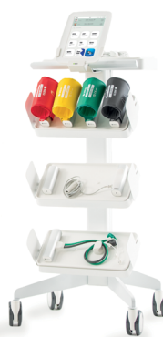
Wózek MESI mTABLET Trolley