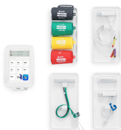
Zestaw z montażem ściennym